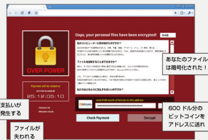
ランサムウェア（ワナクライ）の身代金要求画面